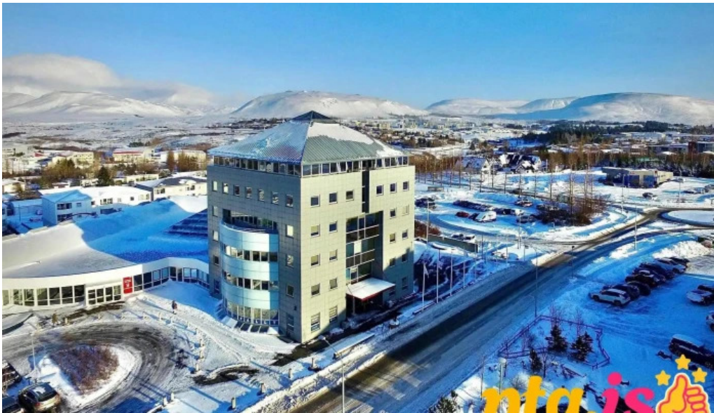
Mosfellsbaer city hall fra eiganda