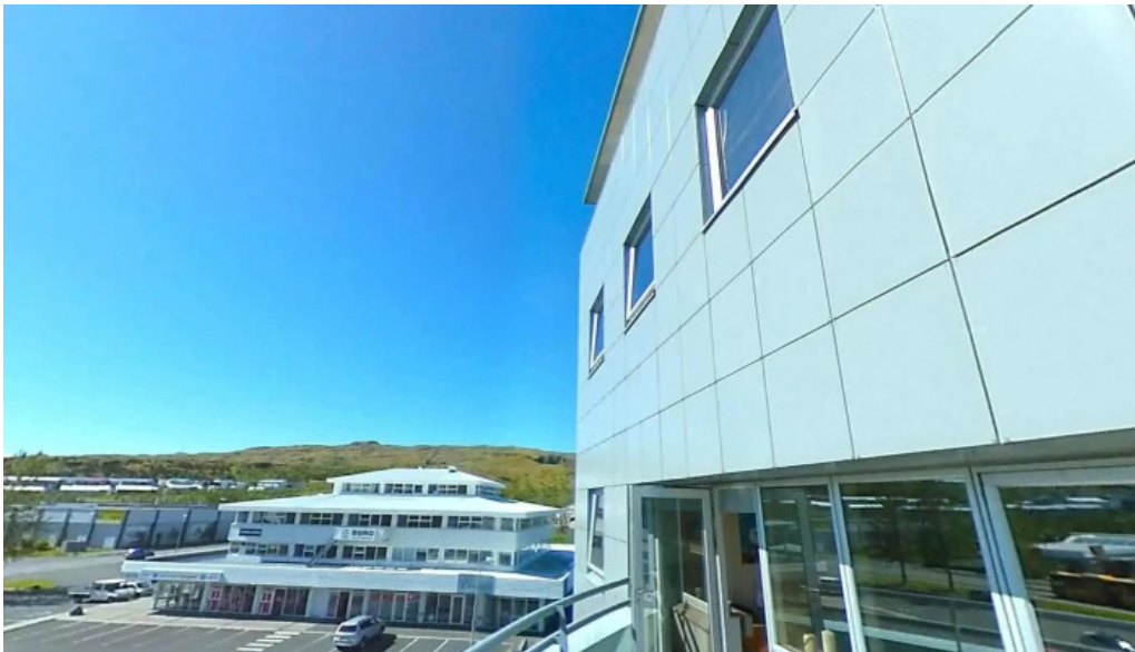
Mosfellsbaer city hall street view 360