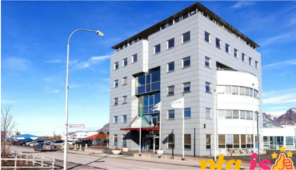
Mosfellsbaer city hall bæjarskrifstofa