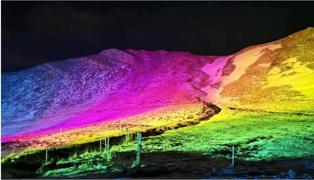
Mosfellsbaer city hall nyjast