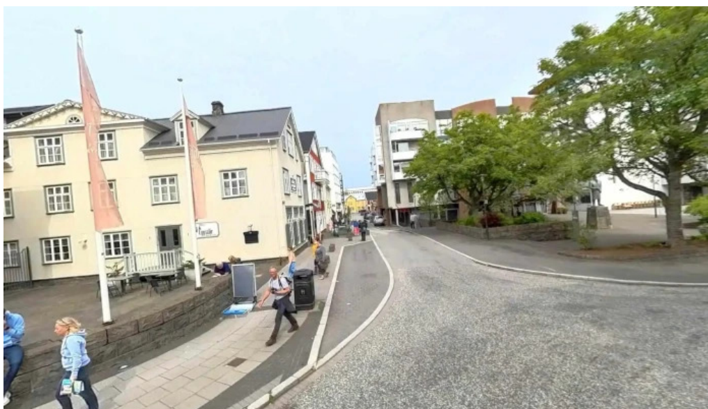
Landnamssyningin street view 360