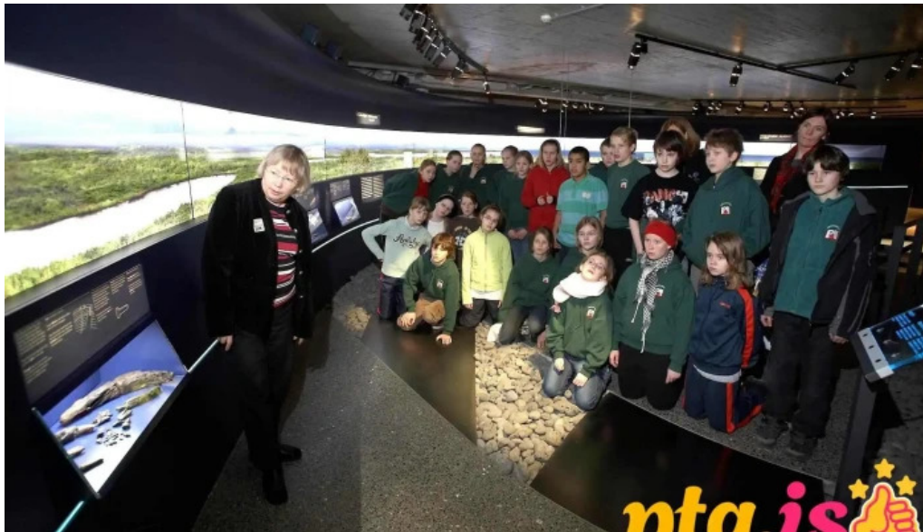
Landnamssýningin fra eiganda