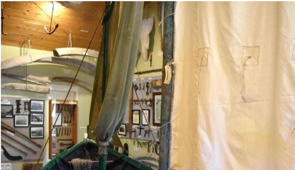
Minjasafn egils olafssonar ad hjoti afslættir