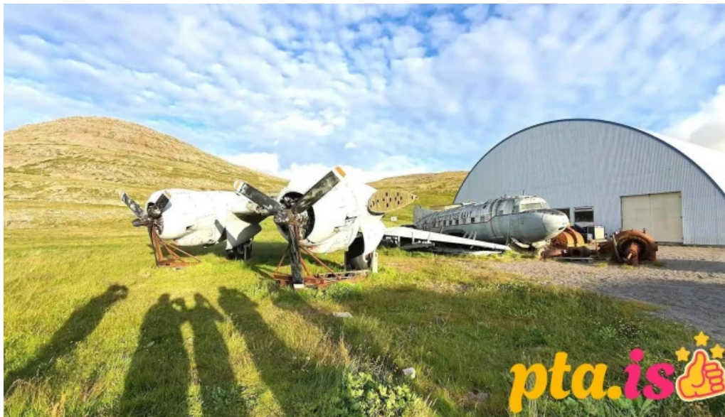
Minjasafn egils olafssonar að hnjoti patreksfjorður