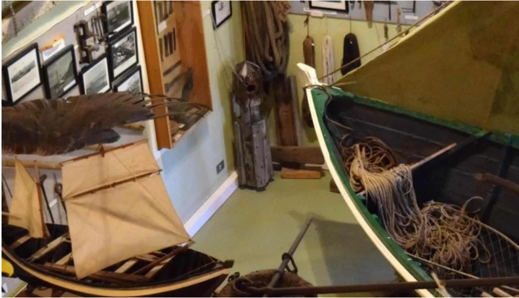
Minjasafn egils olafssonar ad hnjoti hvernig a að komast þangað