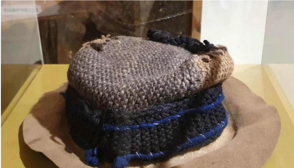
Minjasafn egils olafssonar ad hjoti athugasemdir