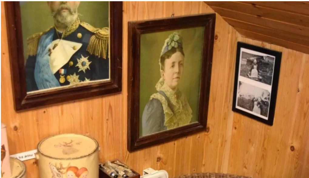
Minjasafn egils olafssonar ad hnjoti heimilisfang