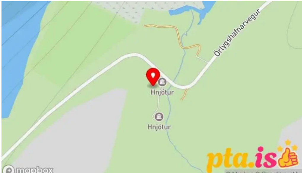
Minjasafn egils olafssonar ad hnjoti Kort