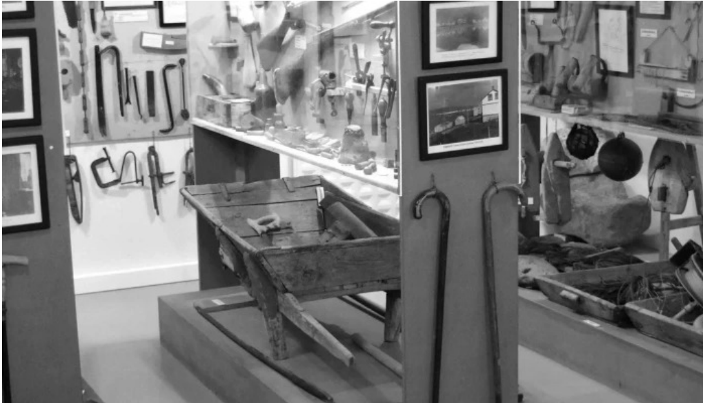
Minjasafn egils olafssonar ad hnjoti numer