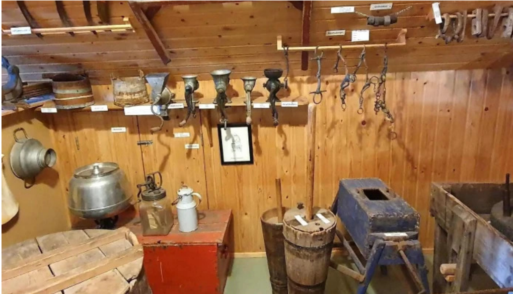
Minjasafn egils olafssonar ad hnjoti einkunn