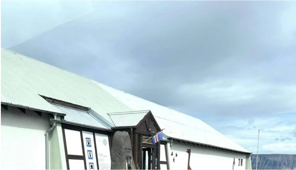
Minjasafn egils olafssonar ad hnjoti safn