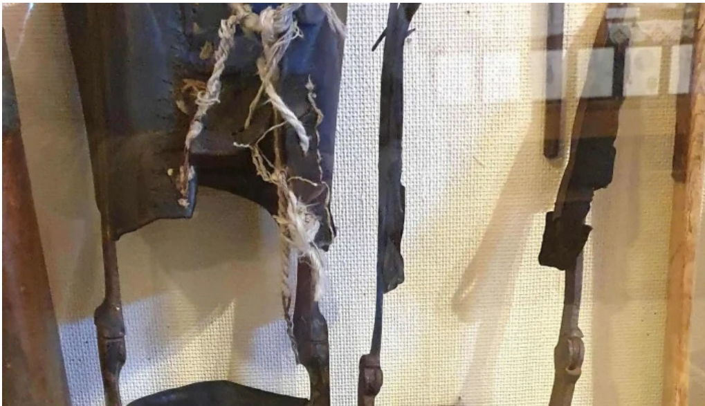
Minjasafn egils olafssonar ad hnjoti patreksfjorður