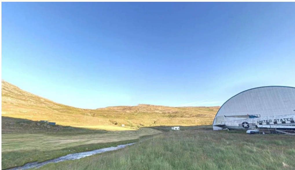
Minjasafn egils olafssonar ad hjoti street view 360deg