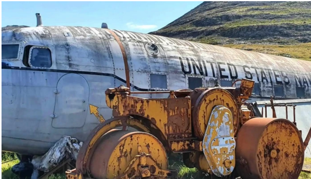
Minjasafn egils olafssonar ad hjoti vefsiða