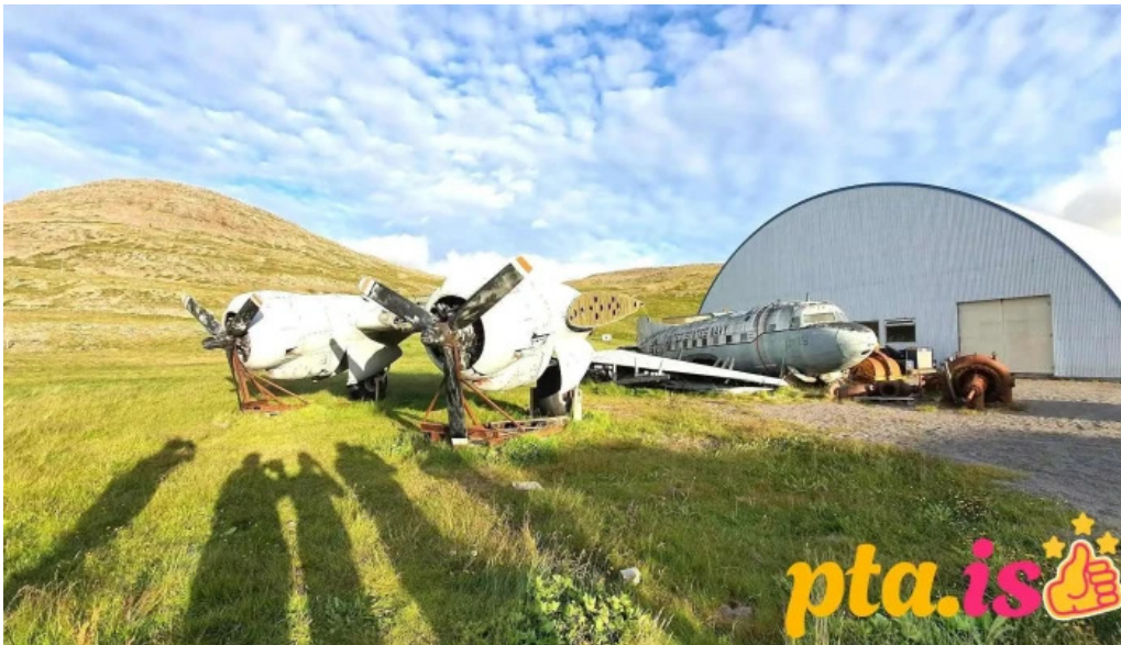
Minjasafn egils olafssonar ad hnjoti byggðasafn