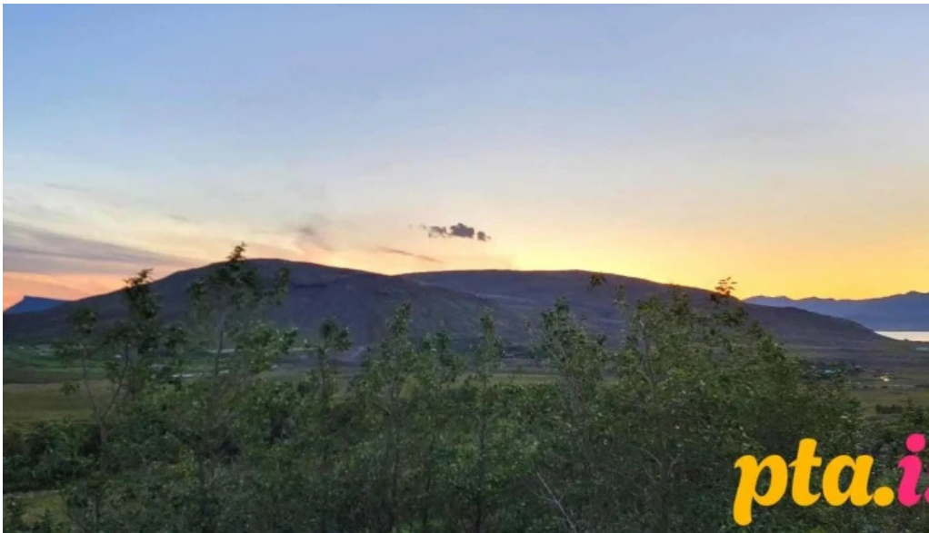
Hlið 69 fra gestum