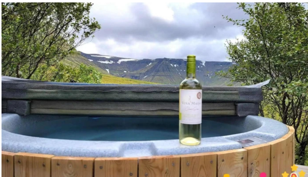
Hlid 69 bustaður