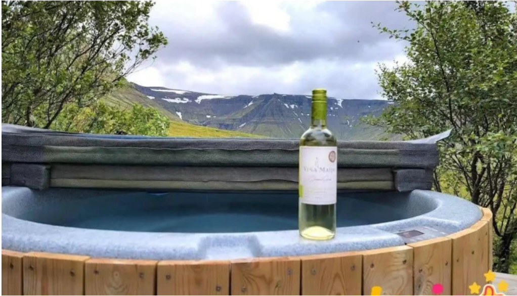
Hlið 69 eilífsdalur