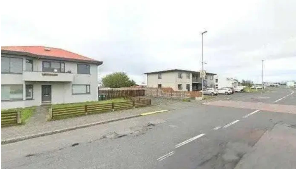
Ithrottamiðstöðin sandgerði bus stop