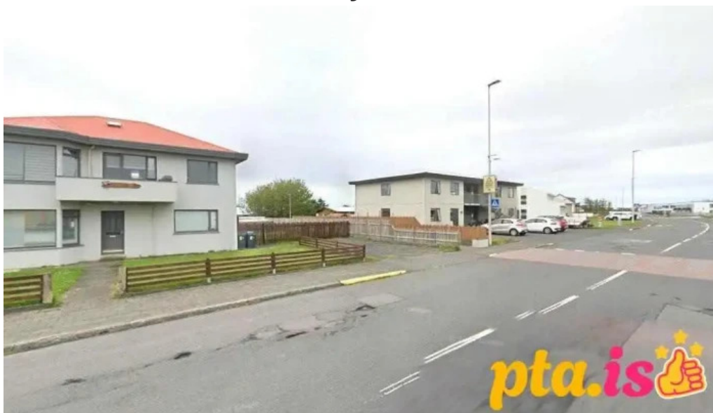
Íþrottamiðstoðin sandgerði sandgerði