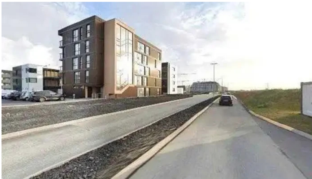
Skardshlid bus stop