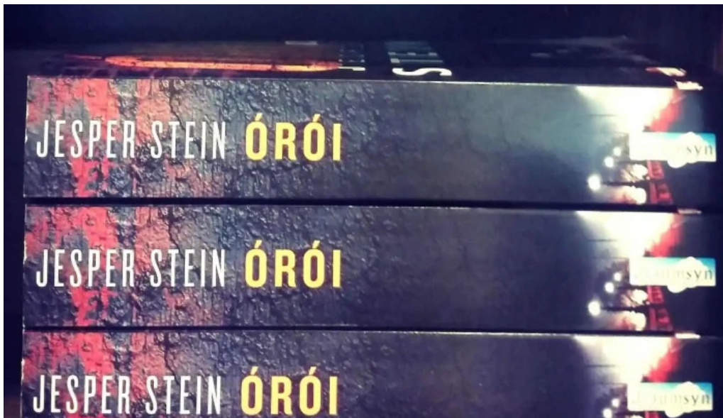
Bóksala studenta fra eiganda