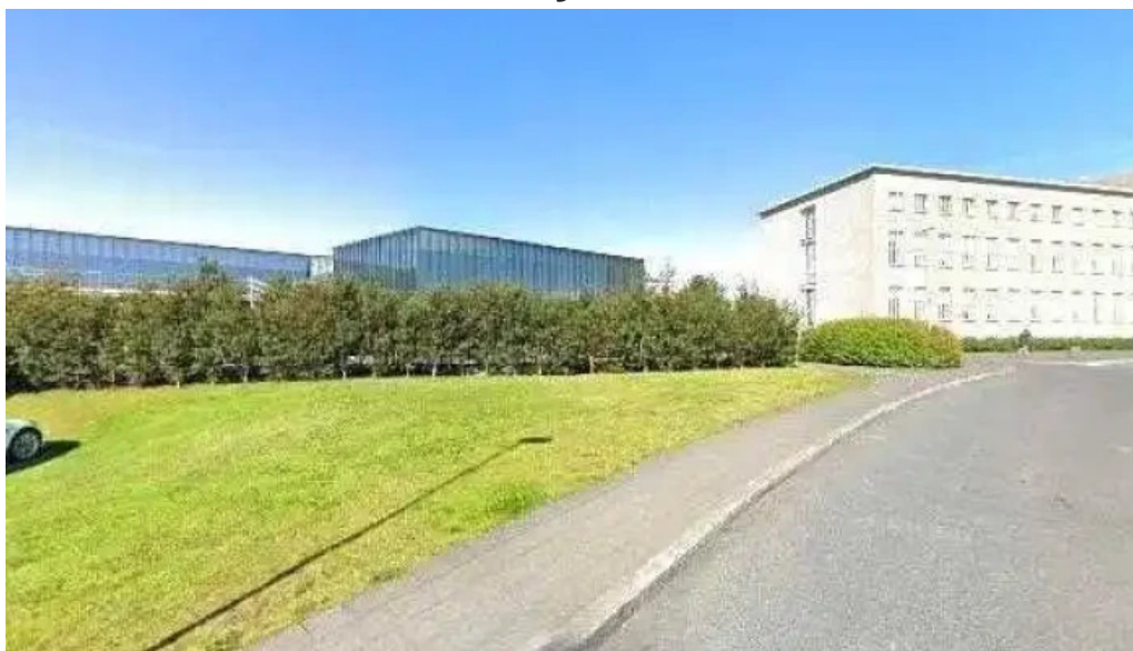
Boksala studenta street view 360