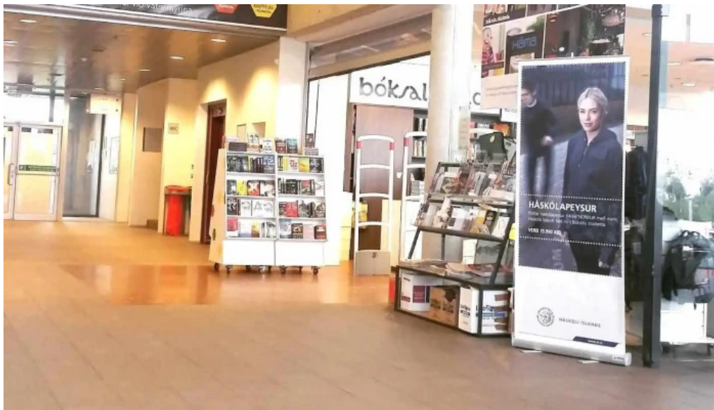
Boksala studenta ad innan