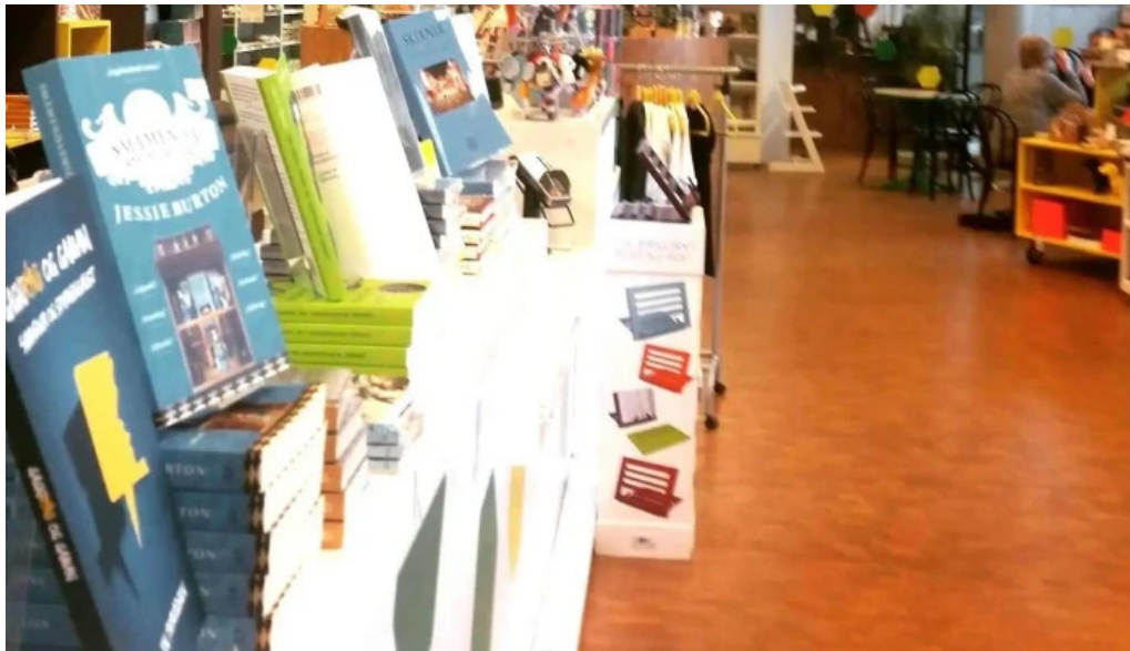
Boksala studenta bokaverslun