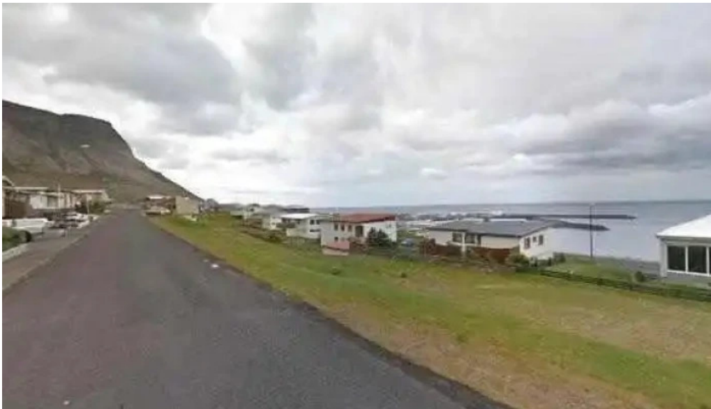
Snæfellsbaer street view 360deg