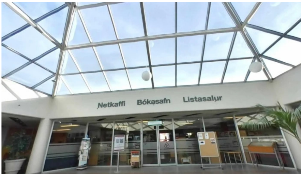
Bokasafn mosfellsbaejar bokasafn