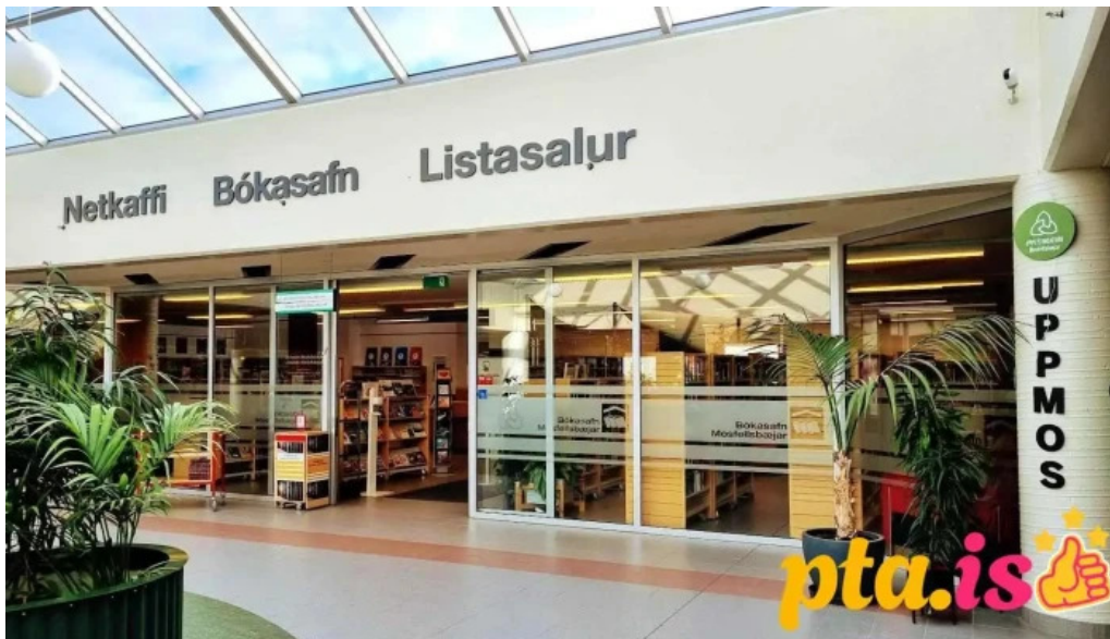
Bokasafn mosfellsbaejar fra eiganda