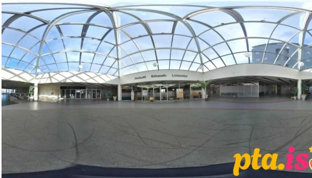
Bokasafn mosfellsbæjar mosfellsbær