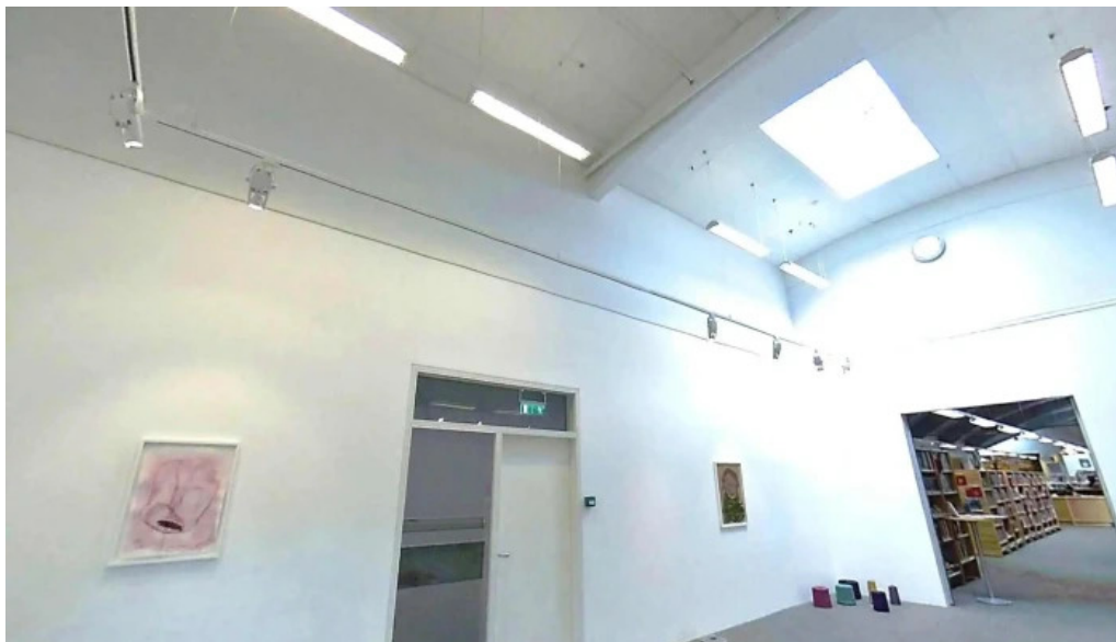
Bokasafn mosfellsbæjar street view 360