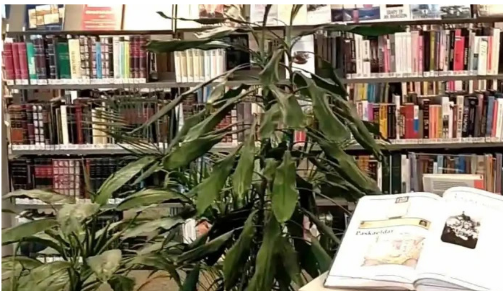
Bokasafn kopavogs myndskid