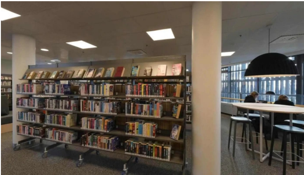
Bokasafn kopavogs street view 360