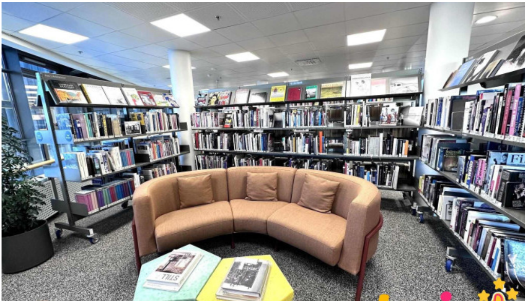
Bokasafn kopavogs bokasafn