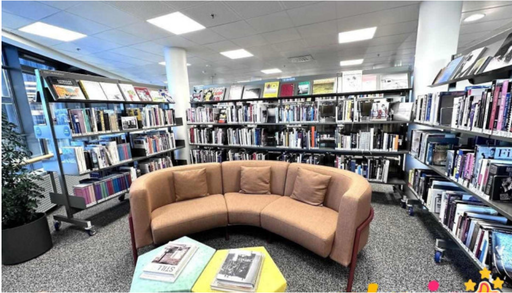
Bokasafn kopavogs kopavogur