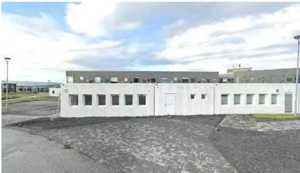
Bokasafn gardabaejar urridaholtssafn bokasafn