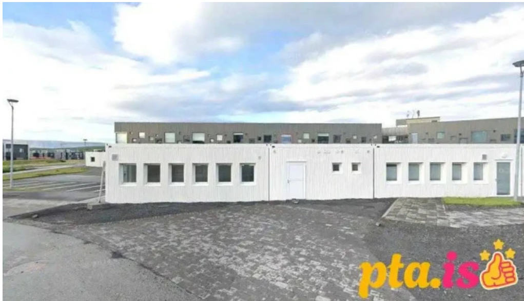
Bokasafn garðabæjar urriðaholtssafn garðabær