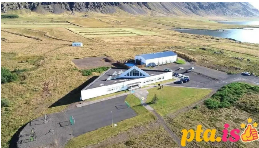
Bokasafnid i breiddal bokasafn