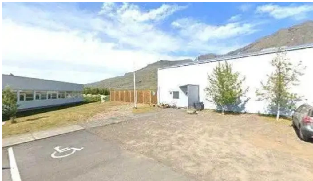
Bokasafnið í breiddal street view 360deg