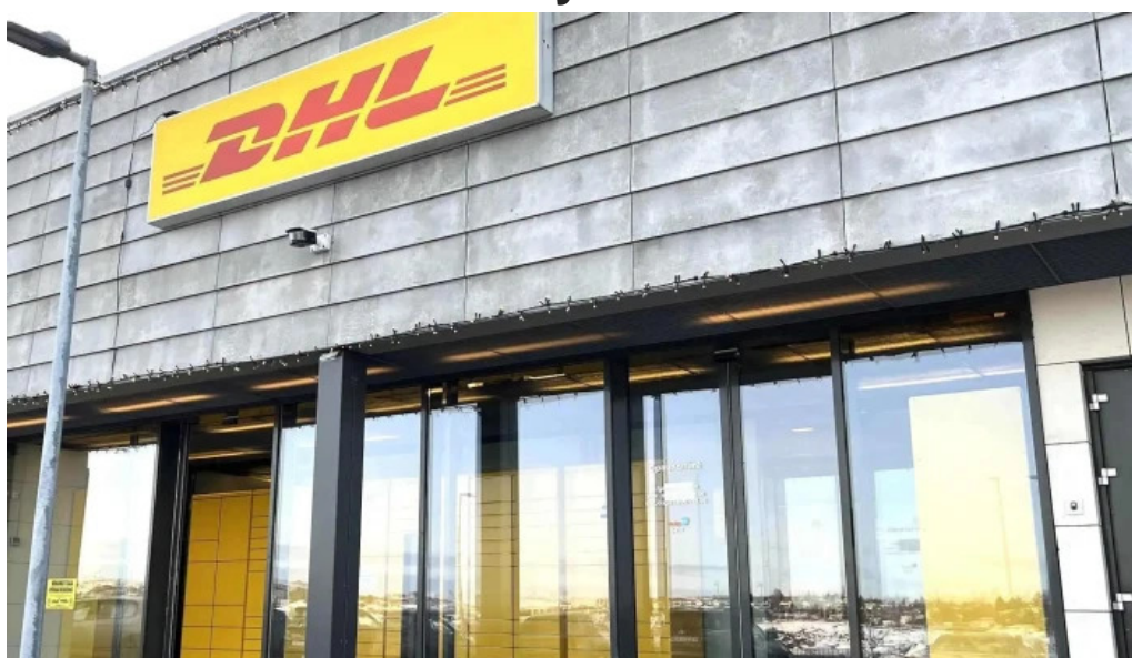
Dhl express island ehf verð