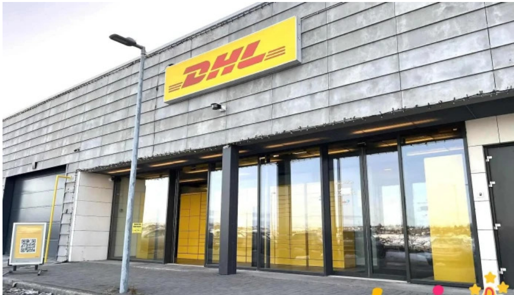
Dhl express island ehf naerumhverfi