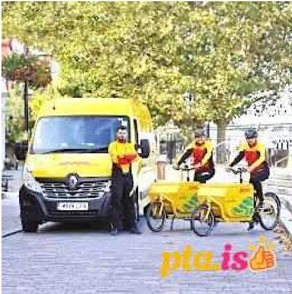
Dhl express island ehf fra eiganda