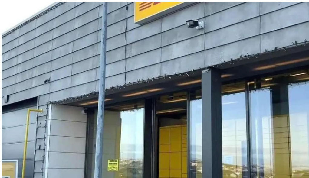
Dhl express island ehf myndskaid