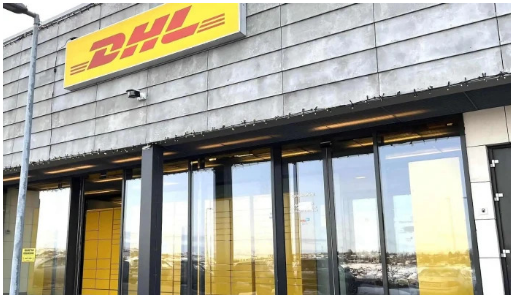
Dhl express island ehf myndbond