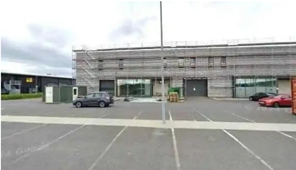
Dhl express island ehf street view 360deg