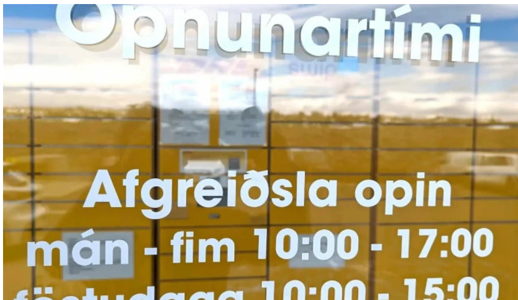
Dhl express island ehf myndir