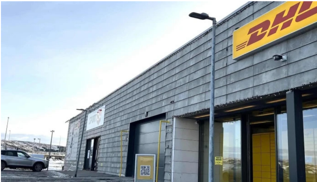
Dhl express island ehf heimilisfang