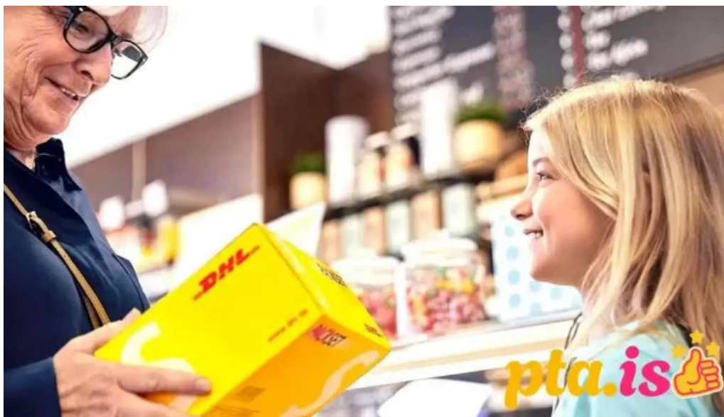
Dhl express island ehf bogglaskapur