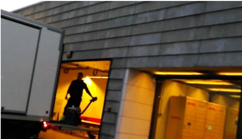
Dhl express island ehf safn