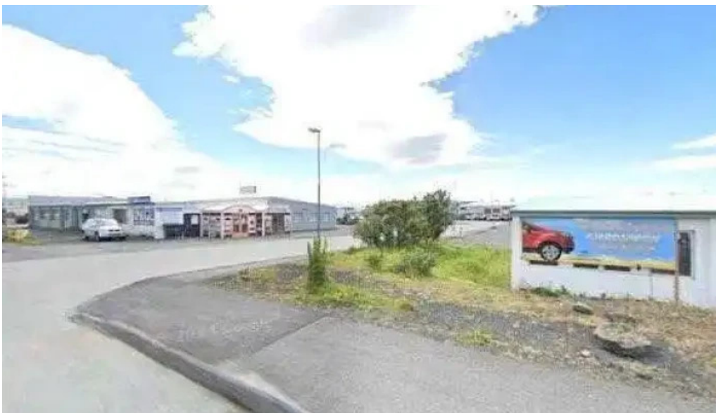
Fjarðarborn street view 360deg