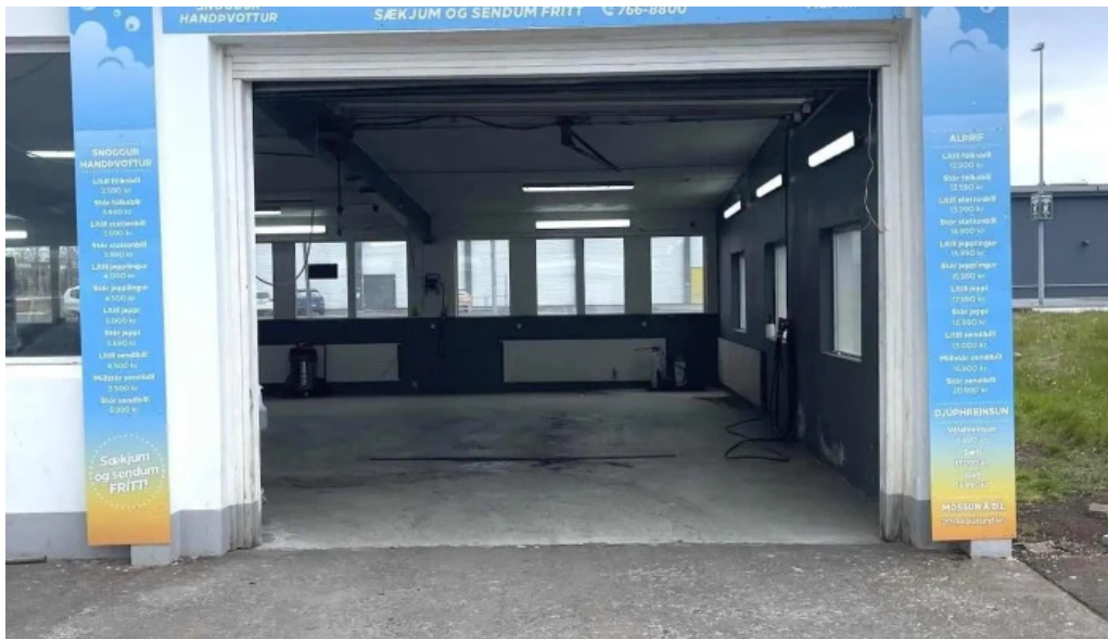
Fjardarþon nær umhverfi