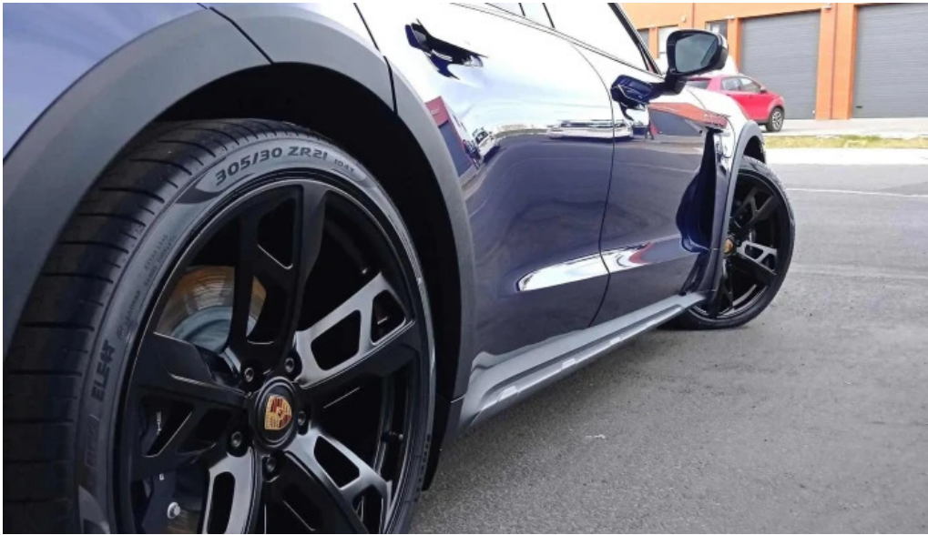
Islandsvorn bilavotta og bonstoð