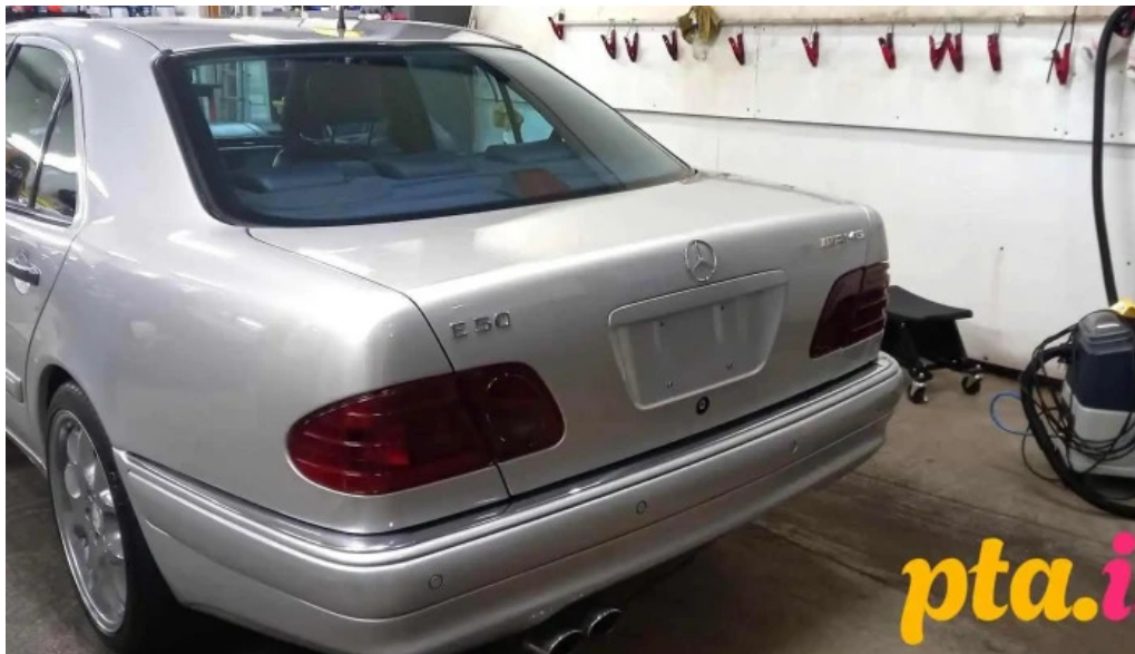
Gaedabon fra eiganda