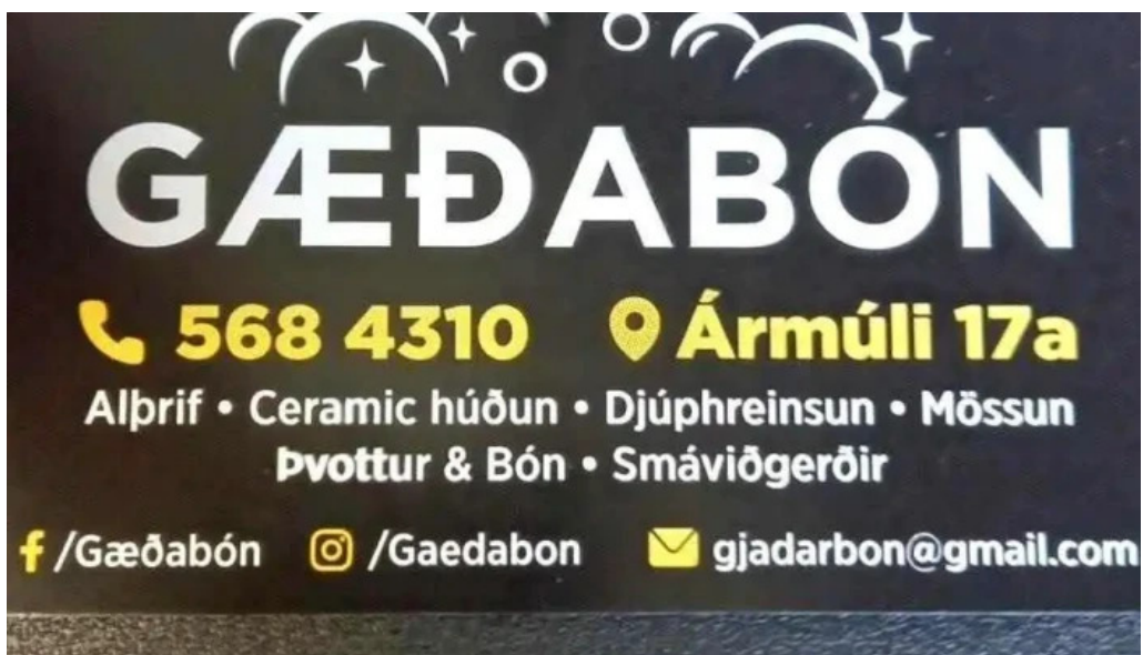
Gaedabon bilapvotta og bonstoð