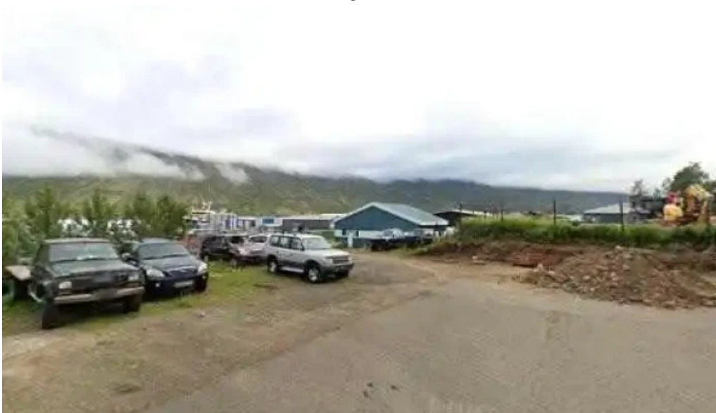
Frumherji street view 360deg