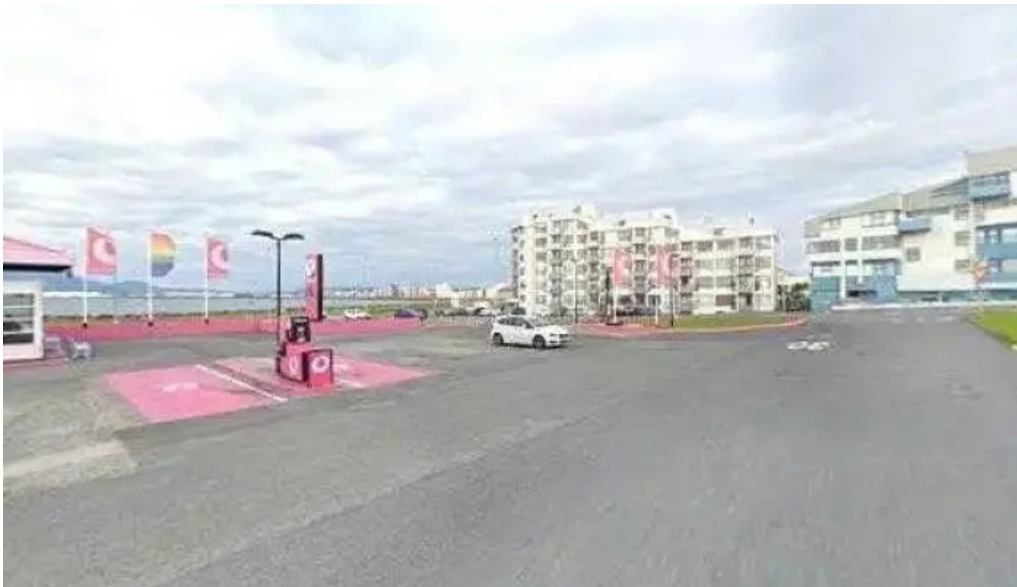
Orkan street view 360