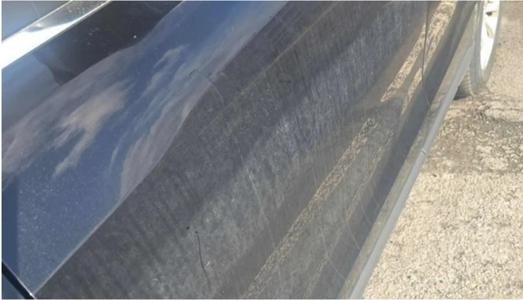
Olis opið nuna