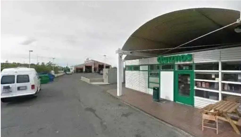
Olis street view 360deg