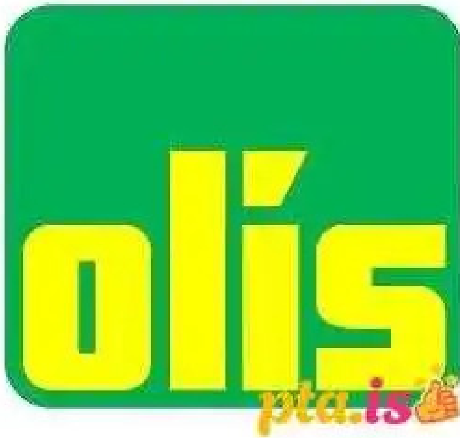
Olis fra eiganda