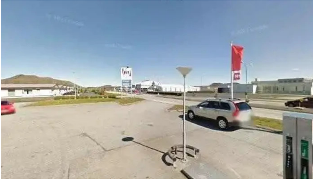
N1 street view 360deg