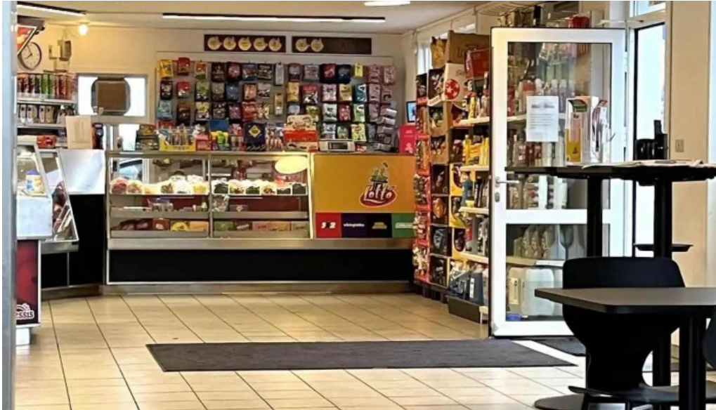
N1 ad innan