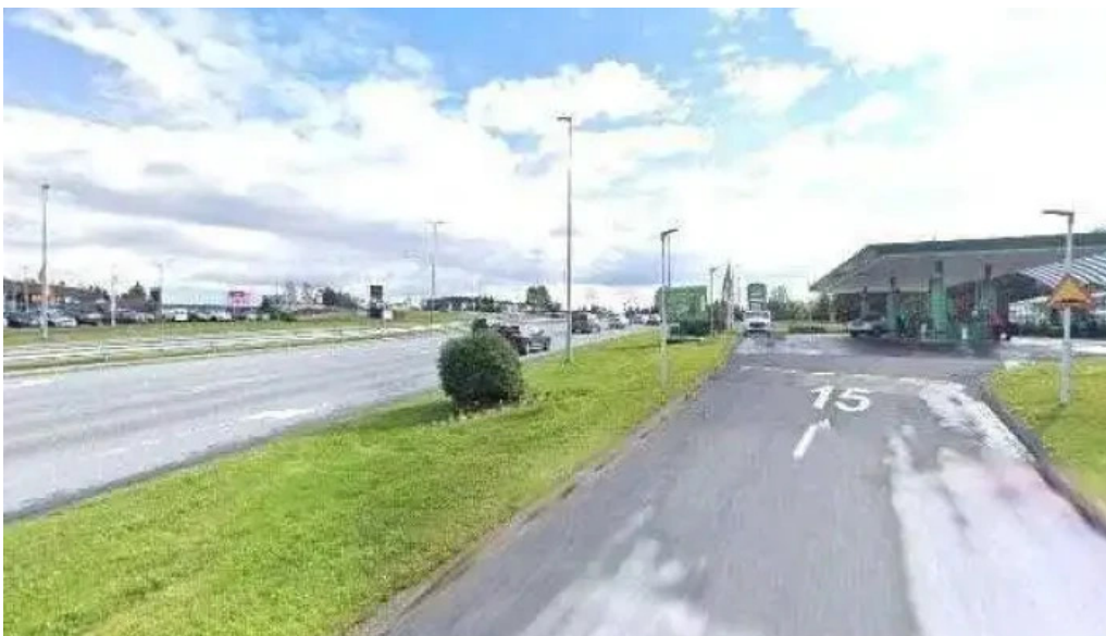
Þhvottaplan fyrir bíla bensinstoð