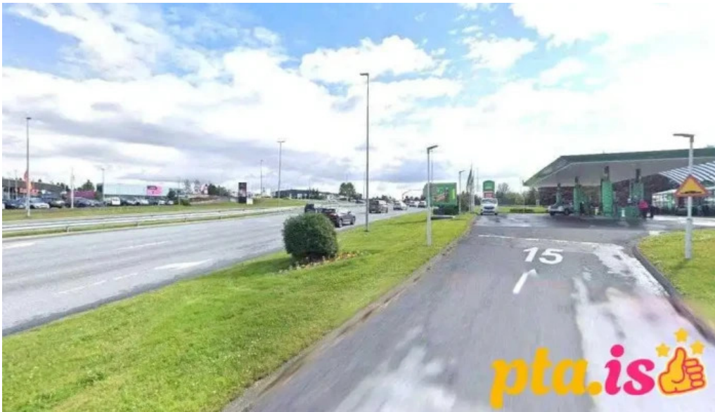
Þvottaplan fyrir bíla garðabær