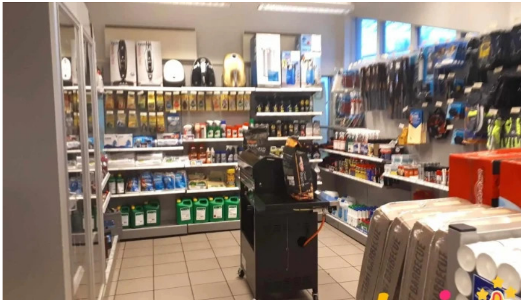
Olís neskaupstad ad innan