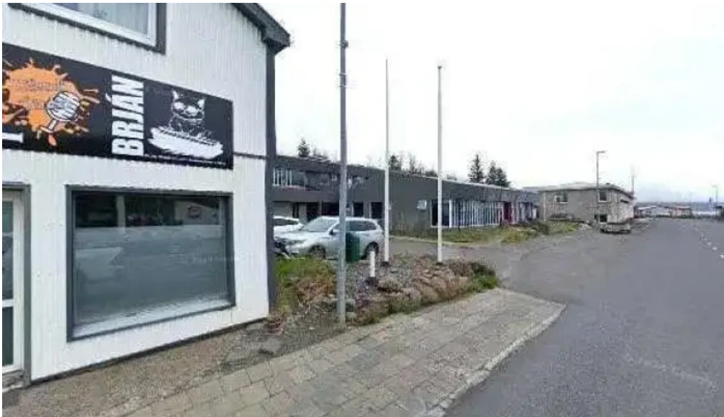
Olis neskaupstad street view 360deg