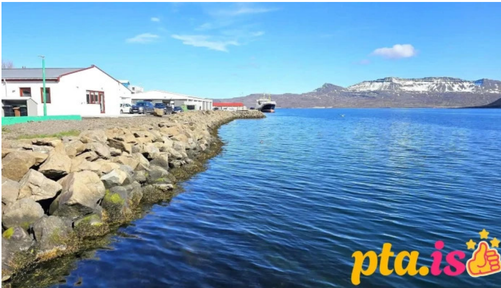
Olis neskaupstad bensinstoð