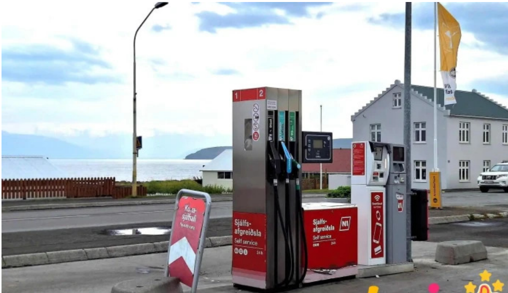
N1 self service bensinstod