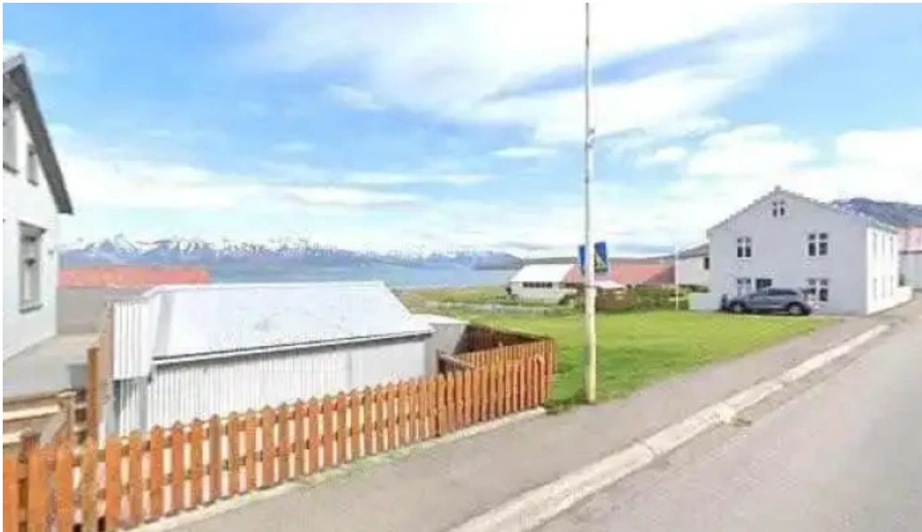
N1 self service street view 360deg