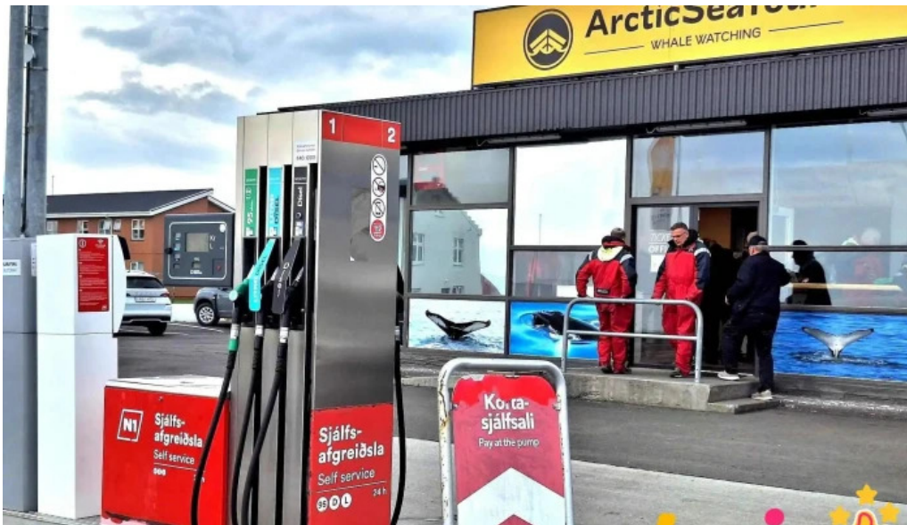
N1 self service bensinstoð