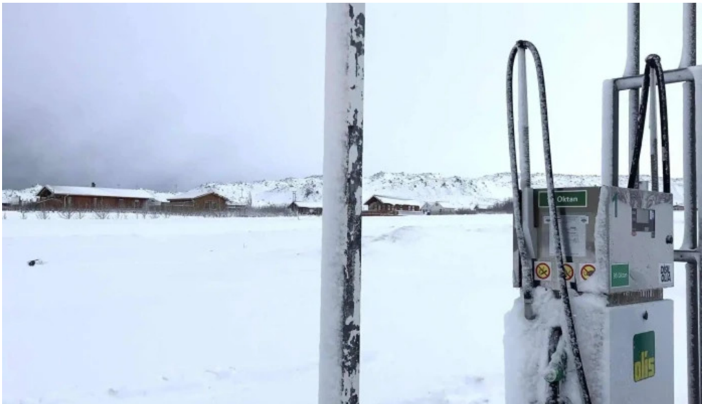
Olis gas station kynning