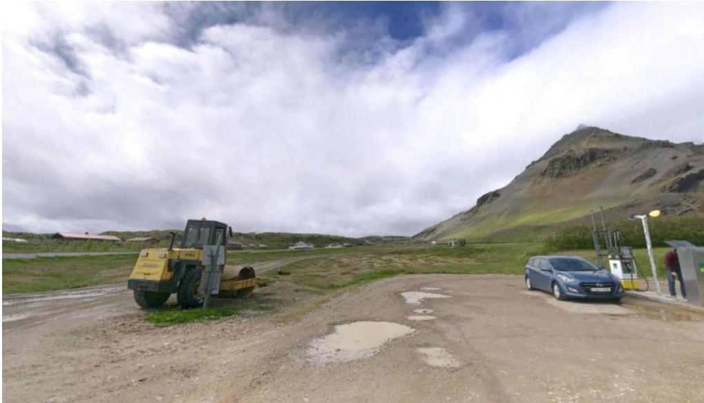
Olis gas station street view 360deg