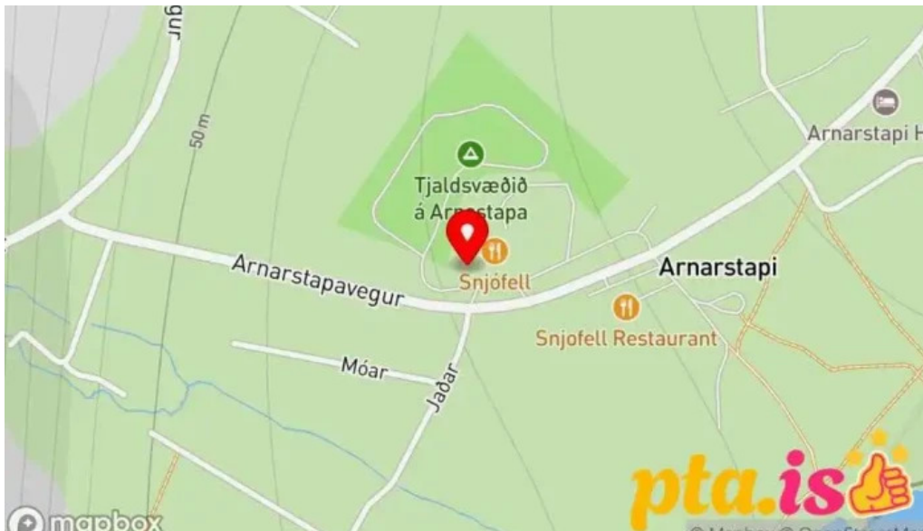
Olís gas station Kort