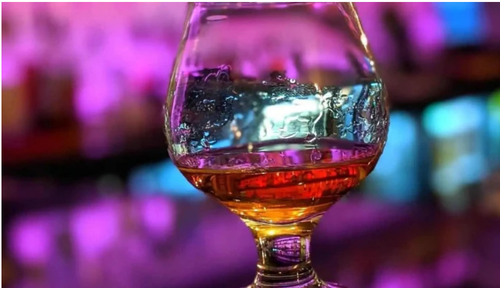
Olhusid olstofa hafnarfjardar matur og drykkur