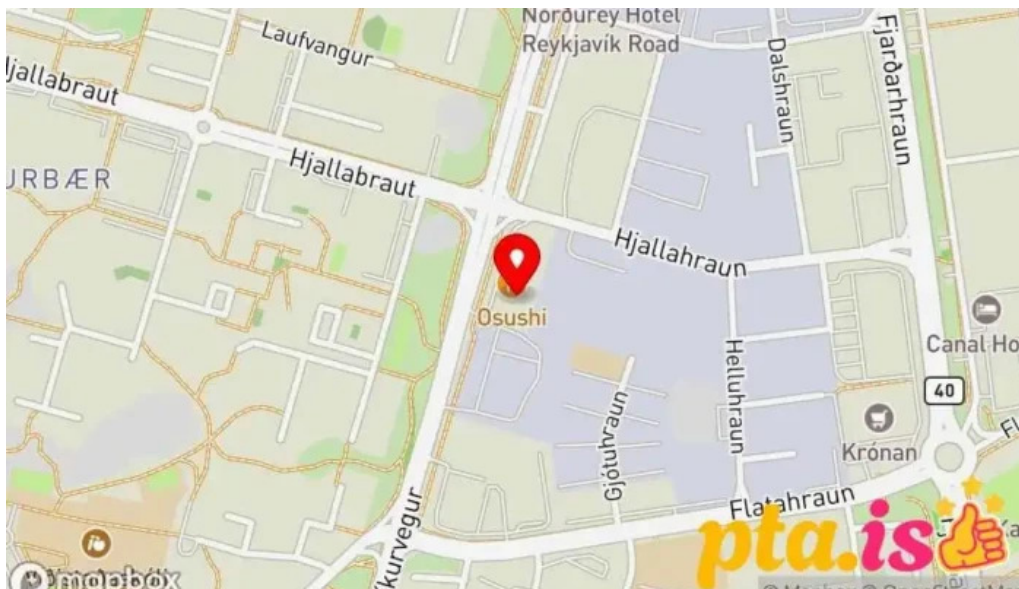
Olhusid olstofa hafnarfjardar Kort