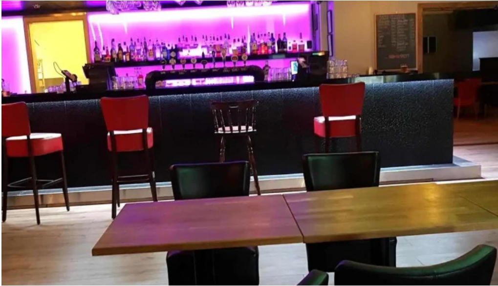
Olhusid olstofa hafnarfjardar stemning