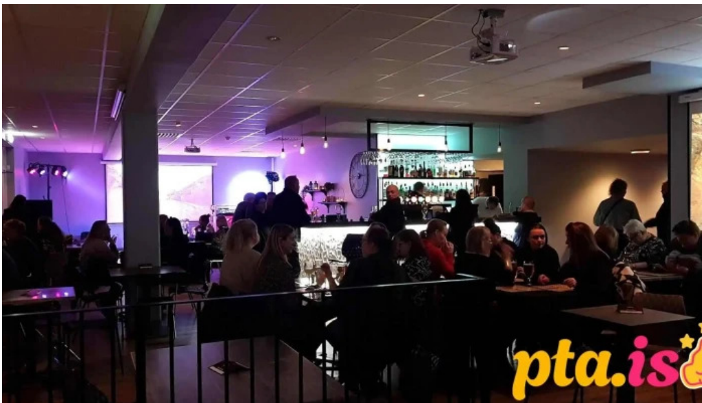
Olhusid olstofa hafnarfjardar bar og grill