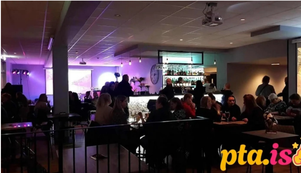
Olhusið olstofa hafnarfjarðar hafnarfjorður