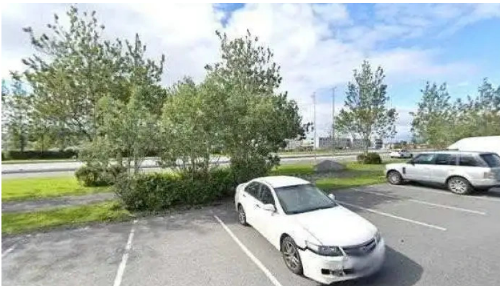
Olhusið olstofa hafnarfjardar street view 360