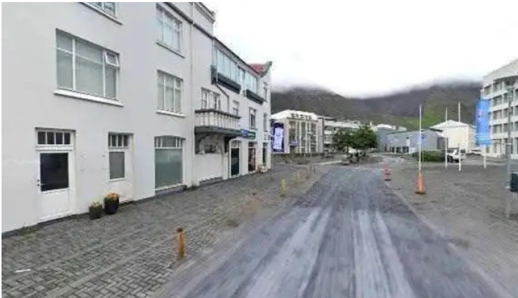
Islandsbanki street view 360deg