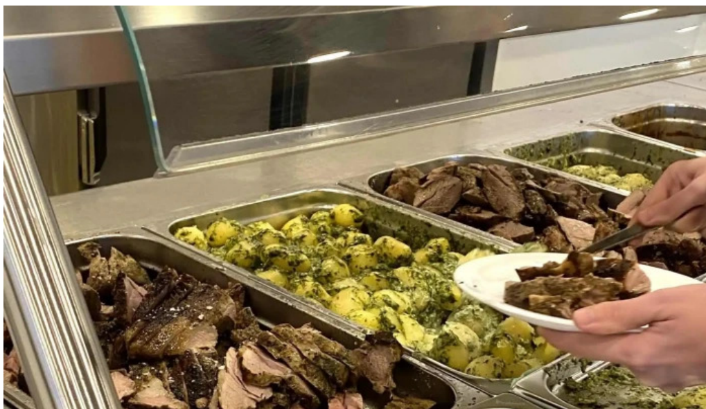
Alverid í straumsvík verð