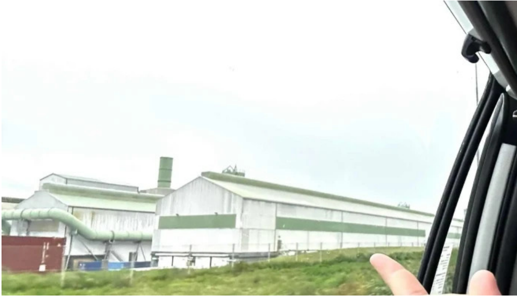
Alverid i straumsvik instagram