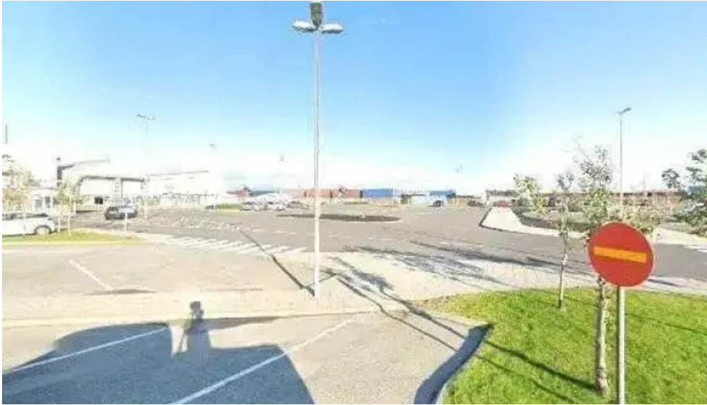
Alverid i straumsvik street view 360deg