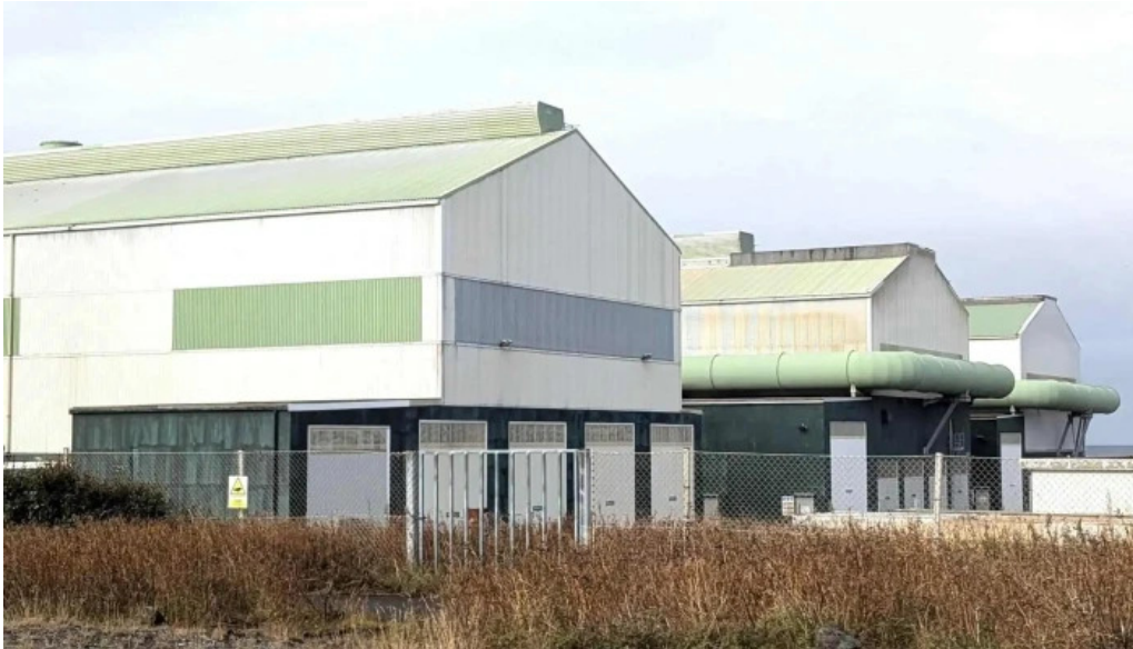
Alverid i straumsvik hafnarfjorður