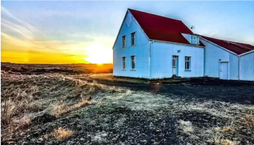
Alverid i straumsvik alver