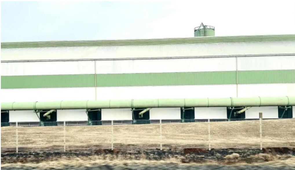
Alverid i straumsvik aætlun