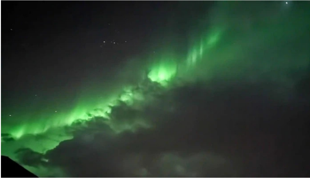
Alverid i straumsvik simi