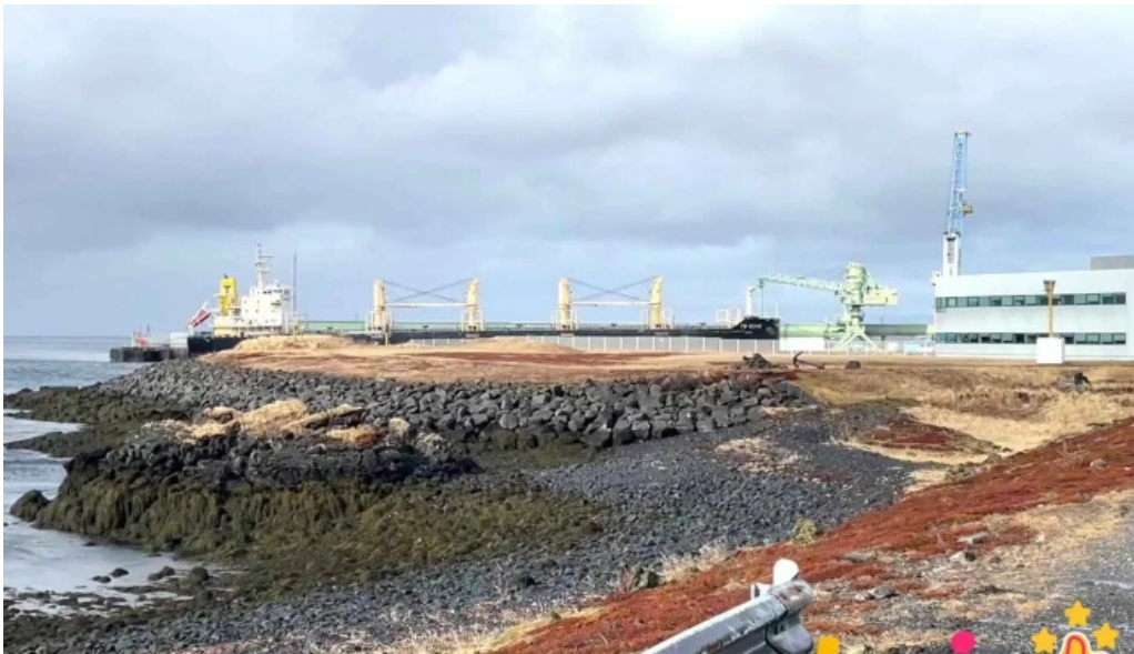
Alverid i straumsvik myndskaid