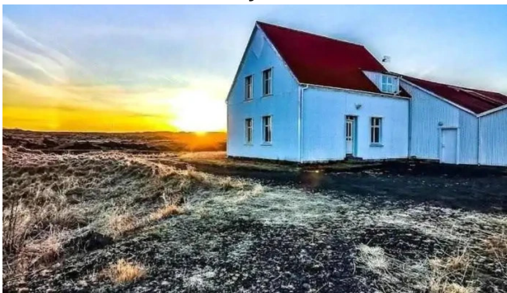
Alverið í straumsvík hafnarfjörður