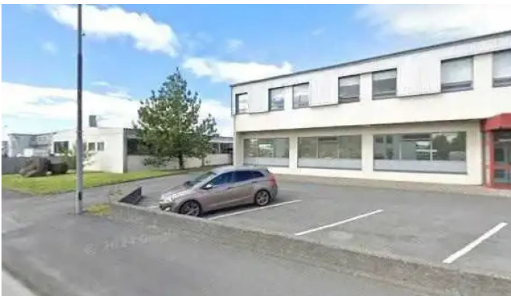
Logreglan a hofudborgarsvaedinu hafnarfjardarstod street view 360deg