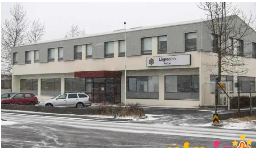
Logreglan a hofuðborgarsvæðinu hafnarfjarðarstöð hafnarfjorður