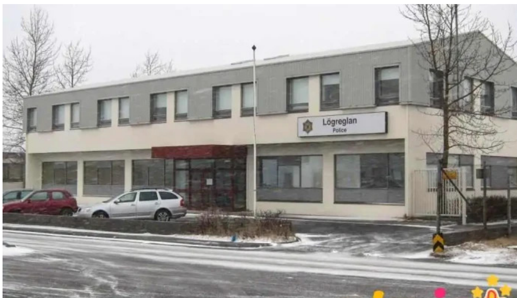
Lögreglan á hofudborgarsvaedinu hafnarfjardarstod alrikislogregla