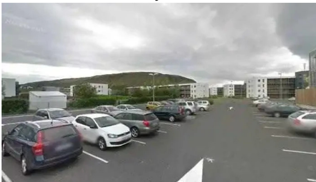
Lagafellslaug street view 360deg