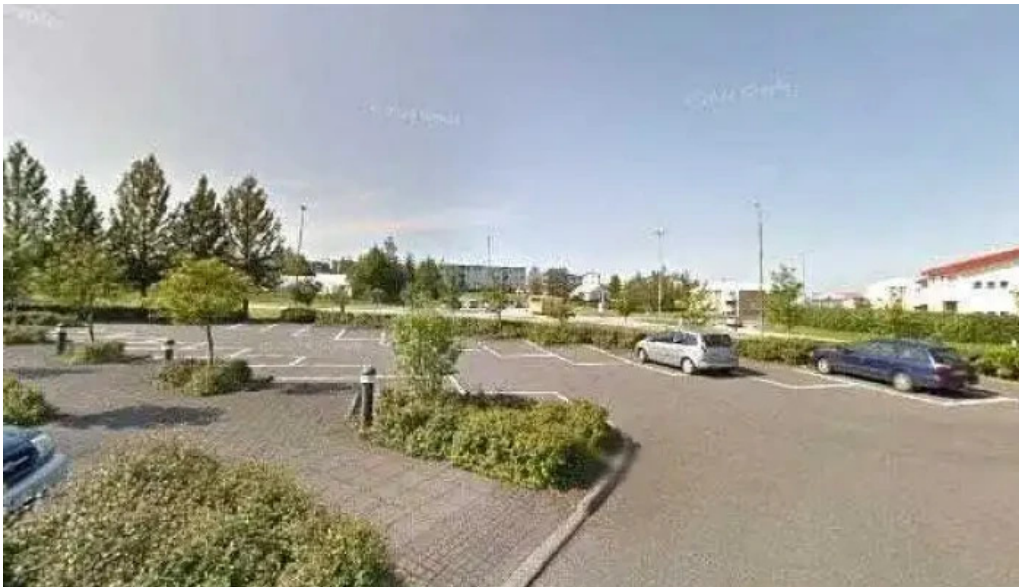
Sudurbæjarlaug street view 360deg