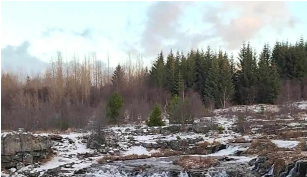
Kermoafoss nálægt mer