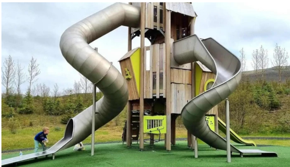
Aevintyragarðurinn í ullarnesbrekkum almenningsgarður