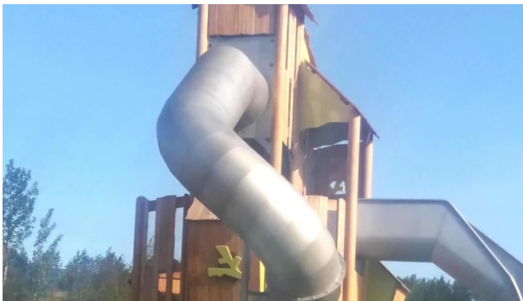
Aevintyragardurinn i ullarnesbrekkum mosfellsbær