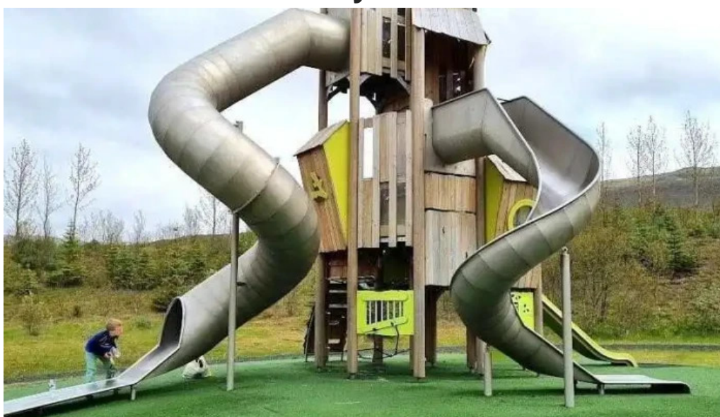
ævintýragarðurinn í ullarnesbrekkum mosfellsbær