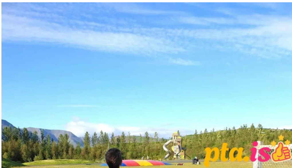
Aevintyragardurinn i ullarnesbrekkum fjall