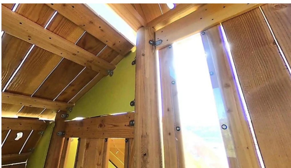
Ævintýragarðurinn í ullarnesbrekkum street view 360deg