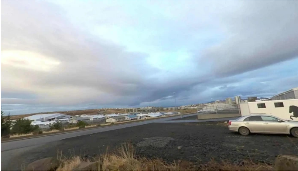
Gudmundarlundur street view 360deg