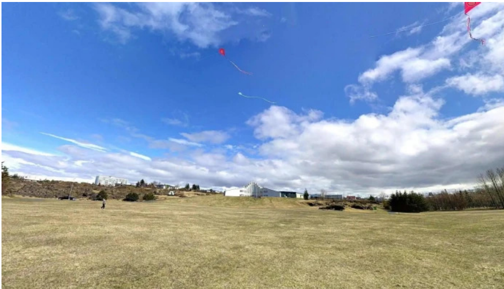
Vidistadatun street view 360