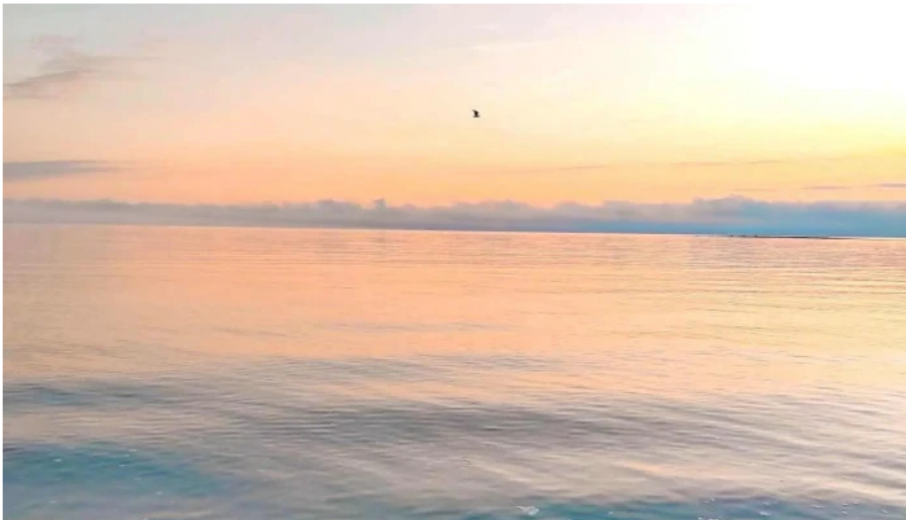
Alftanes beach almenningsgarður