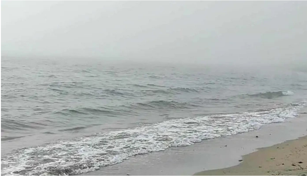
Alftanes beach myndскеid