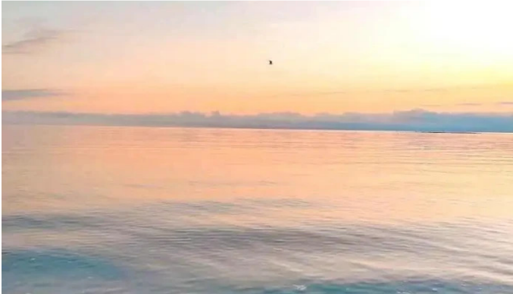
Alftanes beach alftanes